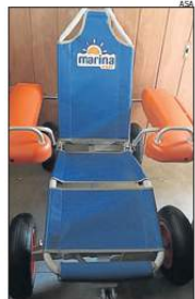
La nueva silla anfibia.

Como parte de las inversiones acordadas en el nuevo contrato de socorrismo y salvamento, el Ayuntamiento de Sant Antoni recibió ayer una nueva silla anfibia que se sumará a las cuatro de las que ya disponía el municipio para dar servicio a las personas con movilidad reducida. De este modo, habrá una silla de estas características en cada una de las zonas de baño de Sant Antoni. En los próximos días está previsto que se