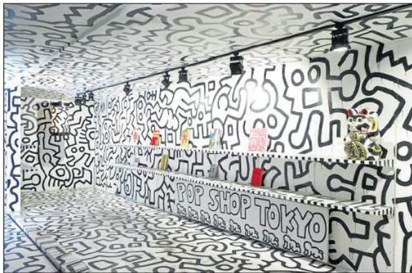
Una de las obras de Keith Haring, 'Pop Shop Tokio'. LA NAVE