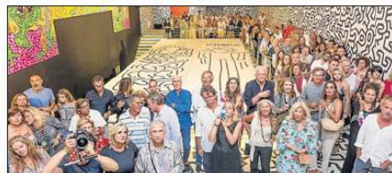
Panorámica de La Nave de ses Salines con la exposición de Keith Haring durante el acto.