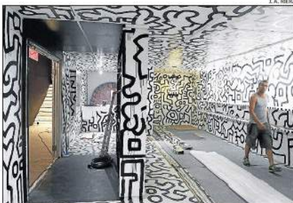
Interior del contenedor 'Pop Shop Tokyo'.