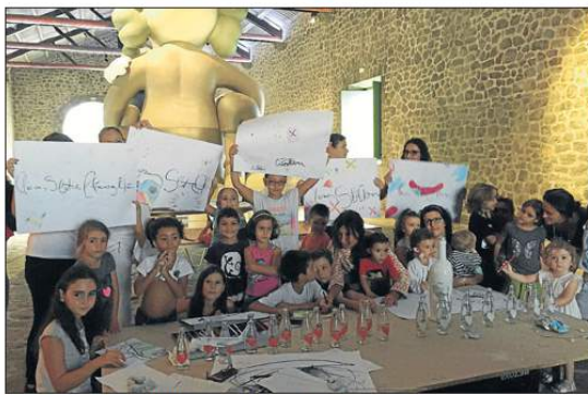
Niños participantes en los talleres celebrados el pasado verano. La Nave