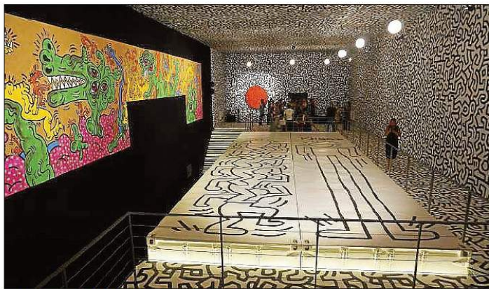
Vista de la exposición de Keith Haring en La Nave de ses Salines.

LA NAVE SALINAS MEDIA: DIARIO DE IBIZA PLATFORM: PAPER AREA: CULTURE PUBLICATION DATE: AUGUST 2017