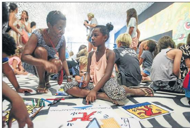
Interior de la Nave Salinas y los niños que asistieron al taller.