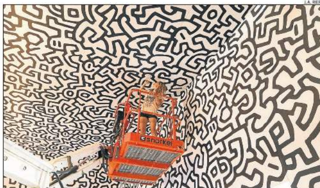
Montaje de los vinilos que recubren toda la superficie interior de La Nave.

El resultado sorprenderá al visitante, sobre todo al que conozca el espacio, ya que las paredes de piedra del antiguo almacén de sal han sido cubiertas con una tarima de madera forrada con metros y metros de vinilo con diseños de Haring